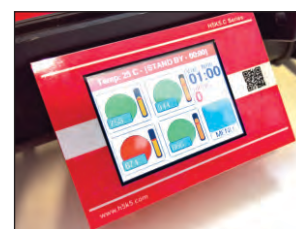
Resultado en pantalla