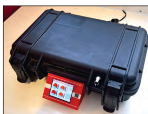
Cerrar la cámara