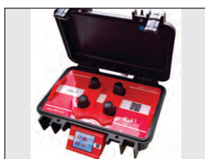
Colocar la muestra